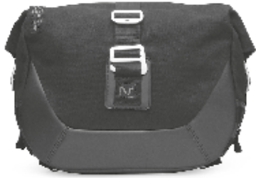
1a 1x Seitentasche LC1 Side Bag LC1 BC.HTA.00.401.10100 L / R