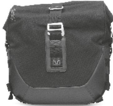
1b 1x Seitentasche LC2 Side Bag LC2 BC.HTA.00.402.10100 L / R