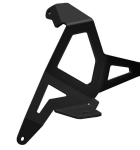
1 Anbaublech Mounting Bracket